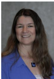
Nova Scotia Director Directrice pour la Nouvelle-Écosse