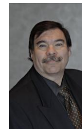
Indigenous Director / Administrateur autochtone