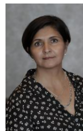
Quebec Anglophone Director Directrice pour le Québec anglophone