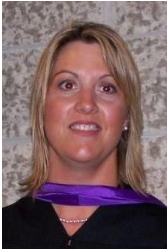
Saskatchewan Director Directrice pour la Saskatchewan