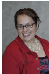
Ontario Francophone Director Directrice pour l'Ontario francophone