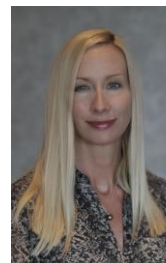
New Brunswick Anglophone Director Directrice pour le Nouveau-Brunswick anglophone