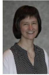
Manitoba & Nunavut Director Directrice pour le Manitoba & le Nunavut