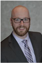
Ontario Anglophone Director Directeur pour l'Ontario anglophone