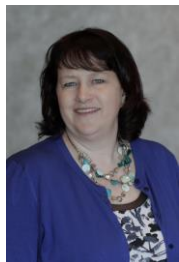
Newfoundland & Labrador Director Directrice pour Terre-Neuve & Labrador