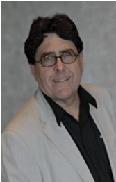
Quebec Francophone Director Directeur pour le Québec francophone