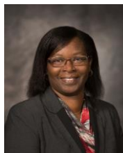
Ontario Francophone Director Directrice pour l'Ontario francophone