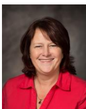
Newfoundland & Labrador Director Directrice pour Terre-Neuve & Labrador