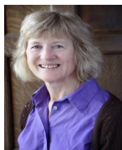
Prince Edward Island Director Directrice pour l'Île-du-Prince-Édouard