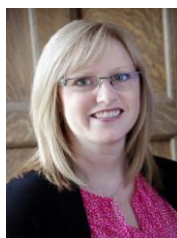
New Brunswick Anglophone Director Directrice pour le Nouveau-Brunswick anglophone