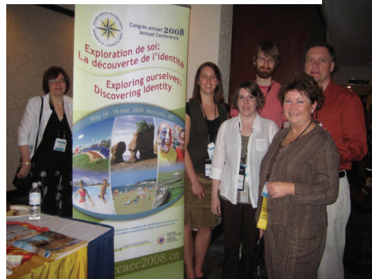
Congrès de l'ACC à Vancouver, mai 07

Représentants étudiants du Nouveau-Brunswick