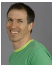
New Brunswick Francophone Director Directeur pour le Nouveau-Brunswick francophone