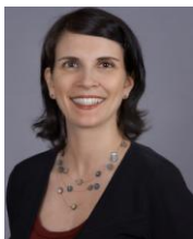
Quebec Francophone Director Directrice pour le Québec francophone