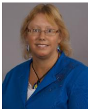
Nova Scotia Director Directrice pour la Nouvelle-Écosse