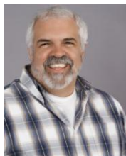
Ontario Francophone Director Directeur pour l'Ontario francophone