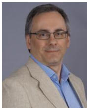
Newfoundland & Labrador Director Directeur pour Terre-Neuve & Labrador