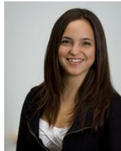
Member Services Coordinator / Coordinatrice des services de membres