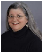
Ontario Anglophone Director Directrice pour l'Ontario anglophone