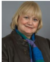
Quebec Anglophone Director Directrice pour le Québec anglophone