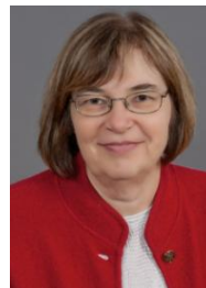
CCDF President (Ex Officio) Présidente de la FCAC (membre d'office)