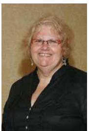
Nova Scotia Director Directrice pour la Nouvelle-Écosse