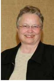
Saskatchewan Director Directrice pour la Saskatchewan