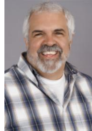
Ontario Francophone Director Directeur pour l'Ontario francophone