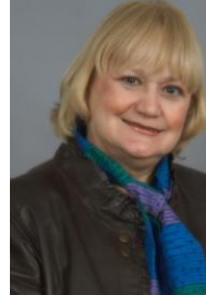
Quebec Anglophone Director Directrice pour le Québec anglophone