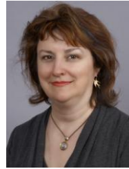
Manitoba & Nunavut Director Directrice pour le Manitoba & le Nunavut