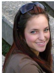
Member Services Coordinator / Coordinatrice des services de membres