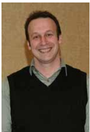
Quebec Francophone Director Directeur pour le Québec francophone