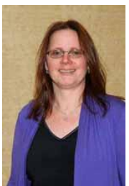
Newfoundland & Labrador Director Directrice pour Terre-Neuve & Labrador