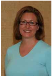
Ontario Anglophone Director Directrice pour l'Ontario anglophone