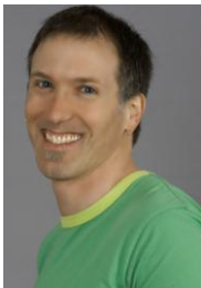
New Brunswick Francophone Director Directeur pour le Nouveau-Brunswick francophone