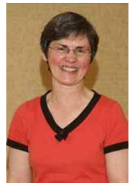
New Brunswick Anglophone Director Directrice pour le Nouveau-Brunswick anglophone