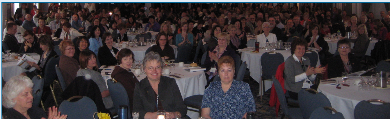
Un aperçu des délégués au Congrès annuel de l'ACCP à Saskatoon, 2009

http://www.ccpa-accp.ca/conference2011/index_fr.php