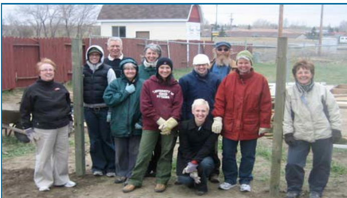
Les membres de la Section justice sociale ont fait du bénévolat pour "Habitat For Humanity" comme initiative au Congrès annuel 2009 de l'ACCP à Saskatoon.

N'hésitez pas à consulter les adresses suivantes : http://counsellorsforsocialjustice.ca http://sj-cca.wikidot.com Si vous êtes un étudiant ou une étudiante qui songez à vous engager avec une section de l'ACCP, je vous le recommande fortement et vous invite à communiquer directement avec un membre de la section. Je vous donne ma parole que ce sera une expérience intéressante qui vous apportera une multitude d'opportunités!